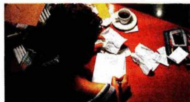
Hoće li nas pozvati na neplaćanje dijelova računa za režije?