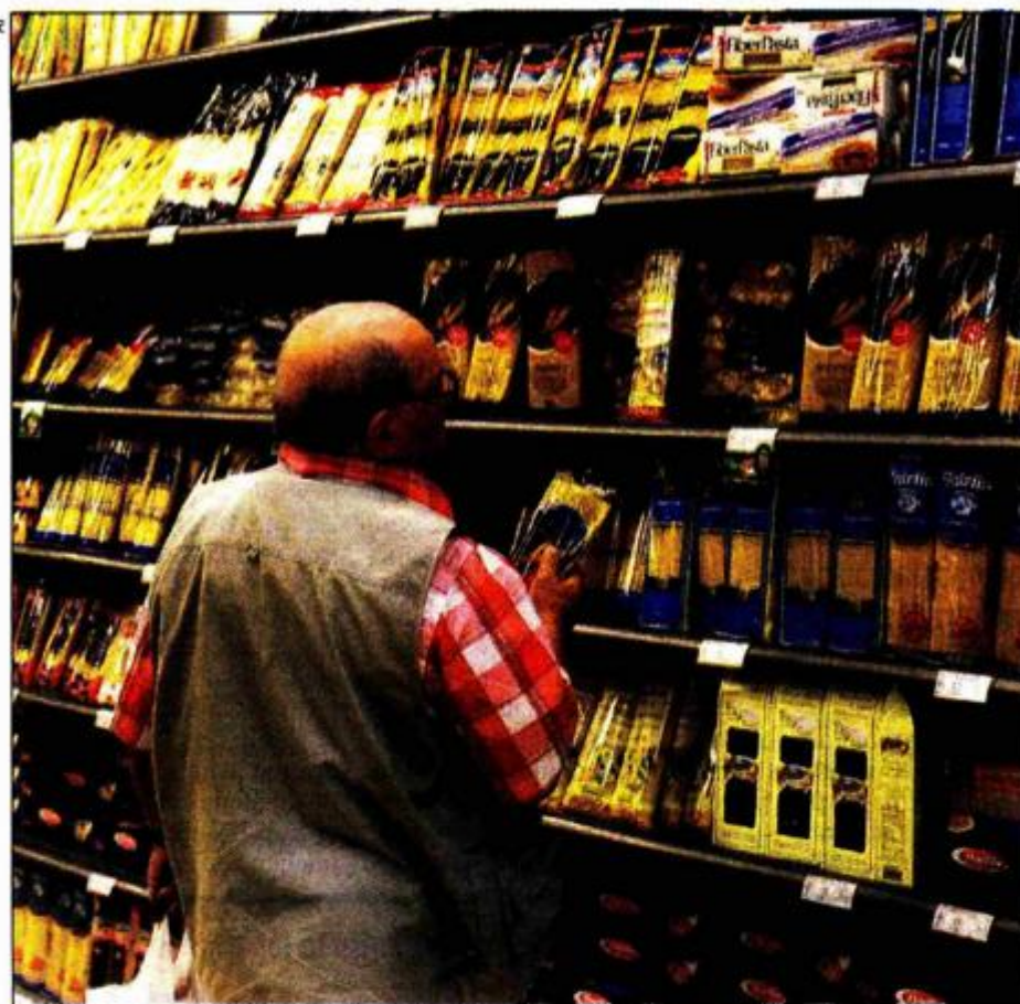
Sedamdeset posto Talijana prošlog rujna zbog skupoće odrekli se omiljene tjestenine